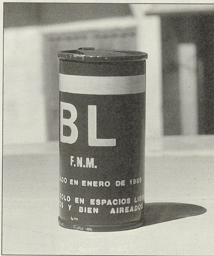
Los botes de humo que lanza la Guardia Civil llevan esta inscripción: "Utilizar sólo en espacios libres, abiertos y bien aireados".

La Guardia Civil no trasladó ni a un solo herido de los que produjo al ambulatorio de Reinosa. Todos quedaron abandonados, y bien por su