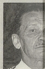
Pita da Veiga

El almirante Pita da Veiga no dimitió, como se ha dicho tantas veces, irritado por la legalización del Partido Comunista. Según fuentes de la cúpula militar, Pita da Veiga , por el contrario, fue uno de los más firmes defensores de tal legalización en aquel Consejo de Ministros presidido por Adolfo Suárez . El almirante dimitió porque vio con claridad que se echaba encima la creación del Ministerio de Defensa, fusionando los tres Ejércitos, y que el ministro sería Gutiérrez Mellado . Aprovechó la crispación por la legalización del PC en el seno del Ejército, y sobre todo en la entonces muy valedora Marina y así, a la vez que se retiraba de la política, satisfacía a sus compañeros de carrera. Es la verdad histórica.