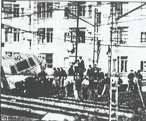
El pasado fin de semana los incidentes cobraron especial virulencia. Incluso se llegaron a volcar algunas máquinas de Renfe para mantenimiento de la red.