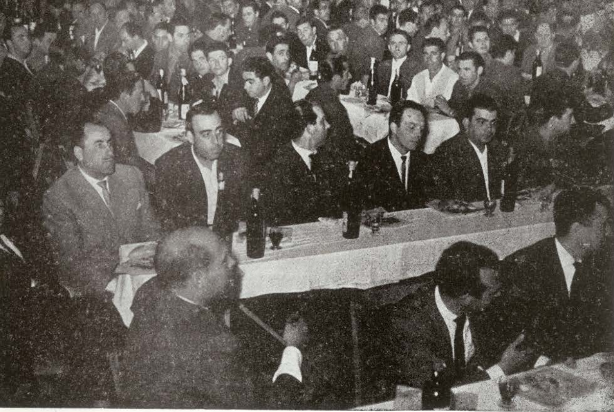
La sala del Cine- ma ofreció el ha- bitual aspecto es- plendente de la clausura de los Cursos de forma- ción al personal.

Ese refranero castellano que es un verdadero cuerno de abundancia en el bien decir y mejor expresar, tiene una sentencia para cualquier cosa; no importa que la índole de ésta sea una u otra.