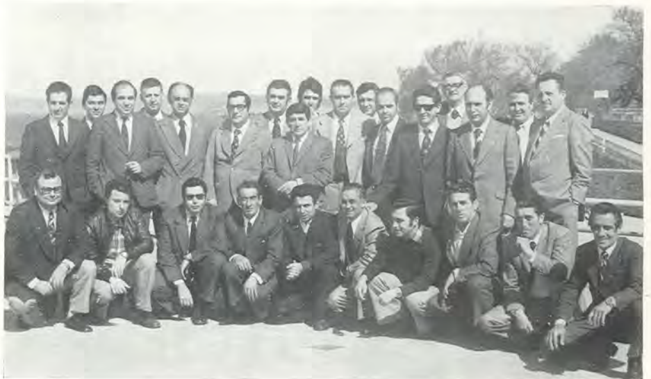
Un grupo en el que aparecen parte de los asistentes a la firma del VII Convenio Colectivo.